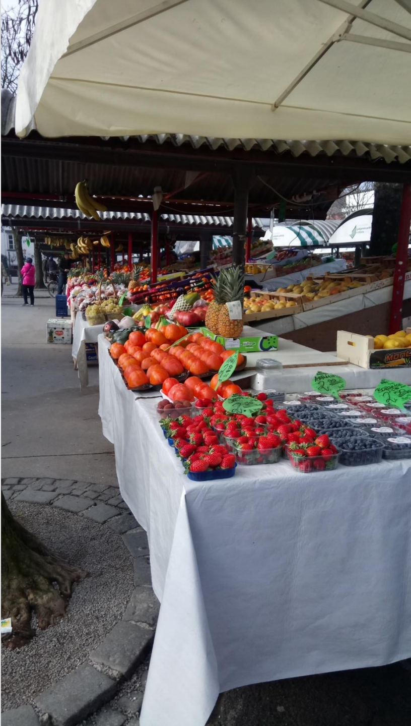
Vodnikov trg, Lublaň