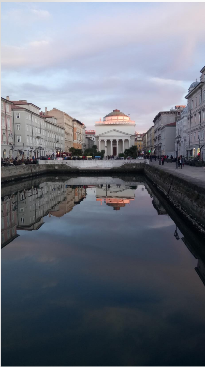
Canale Grande, Terst