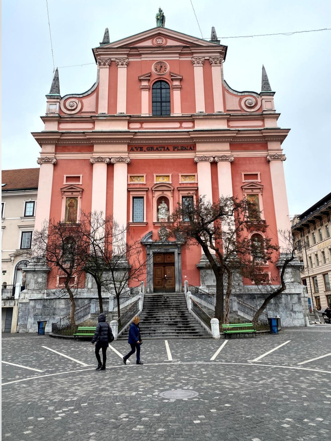
Frančiškanska cerkev, Prešerenovo náměstí, Lublaň