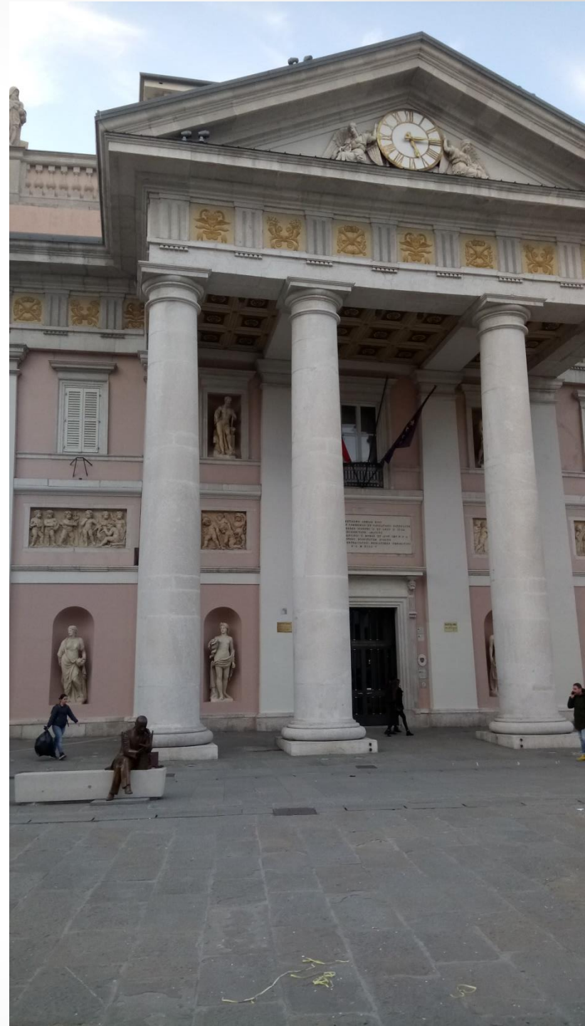
Burzovní palác, Terst